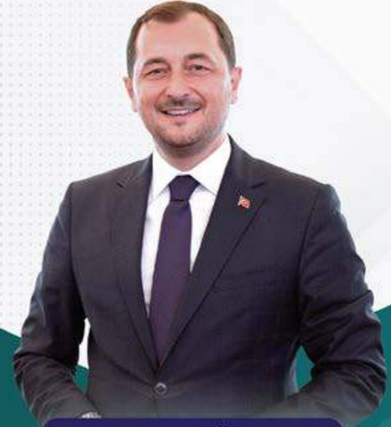
Cüneyt YÜKSEL Süleymanpaşa Belediye Başkanı