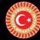
PROF. DR. MUSTAFA ŞENTOP TÜRKİYE BÜYÜK MİLLET MECLİSİ BAŞKANI TEKİRDAĞ MİLLETVEKİLİ