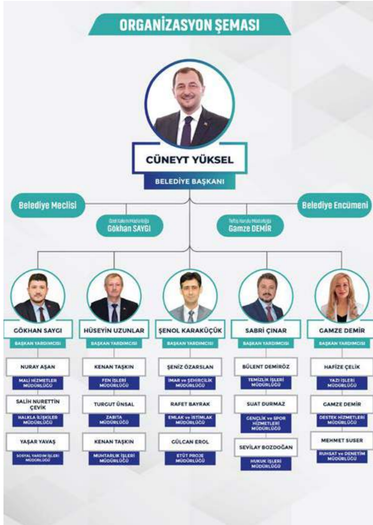
Tablo 2 : İdari Yapı