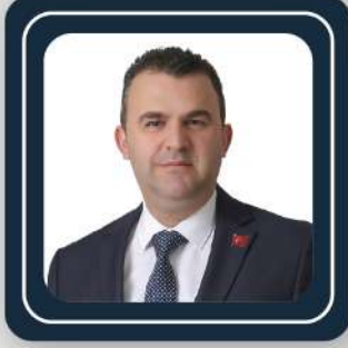
VOLKAN NALLAR BELEDİYE BAŞKANI