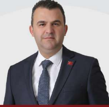
VOLKAN NALLAR SÜLEYMANPAŞA BELEDİYE BAŞKANI